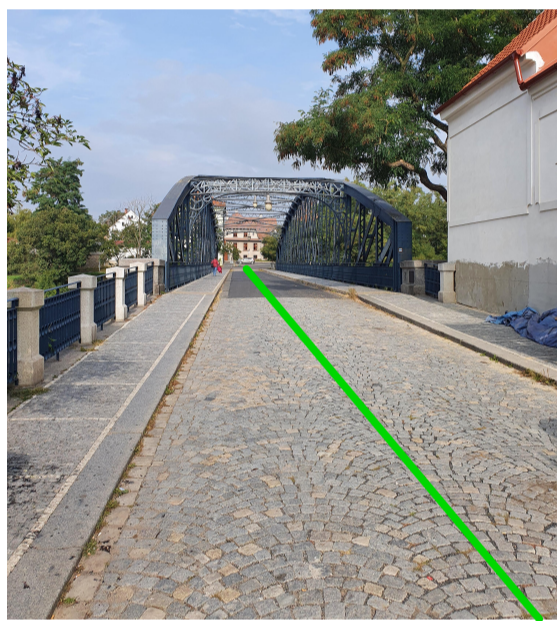
pohled z Husitského náměstí na Železný most (2021)