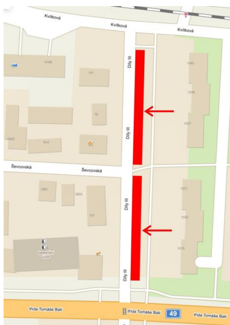
mapa umístění parkoviště