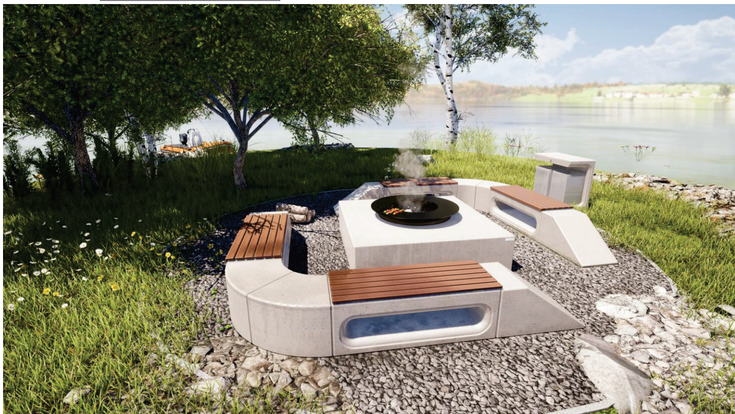
Obrázek 1 Sestava s veřejným ohništěm_symetrie