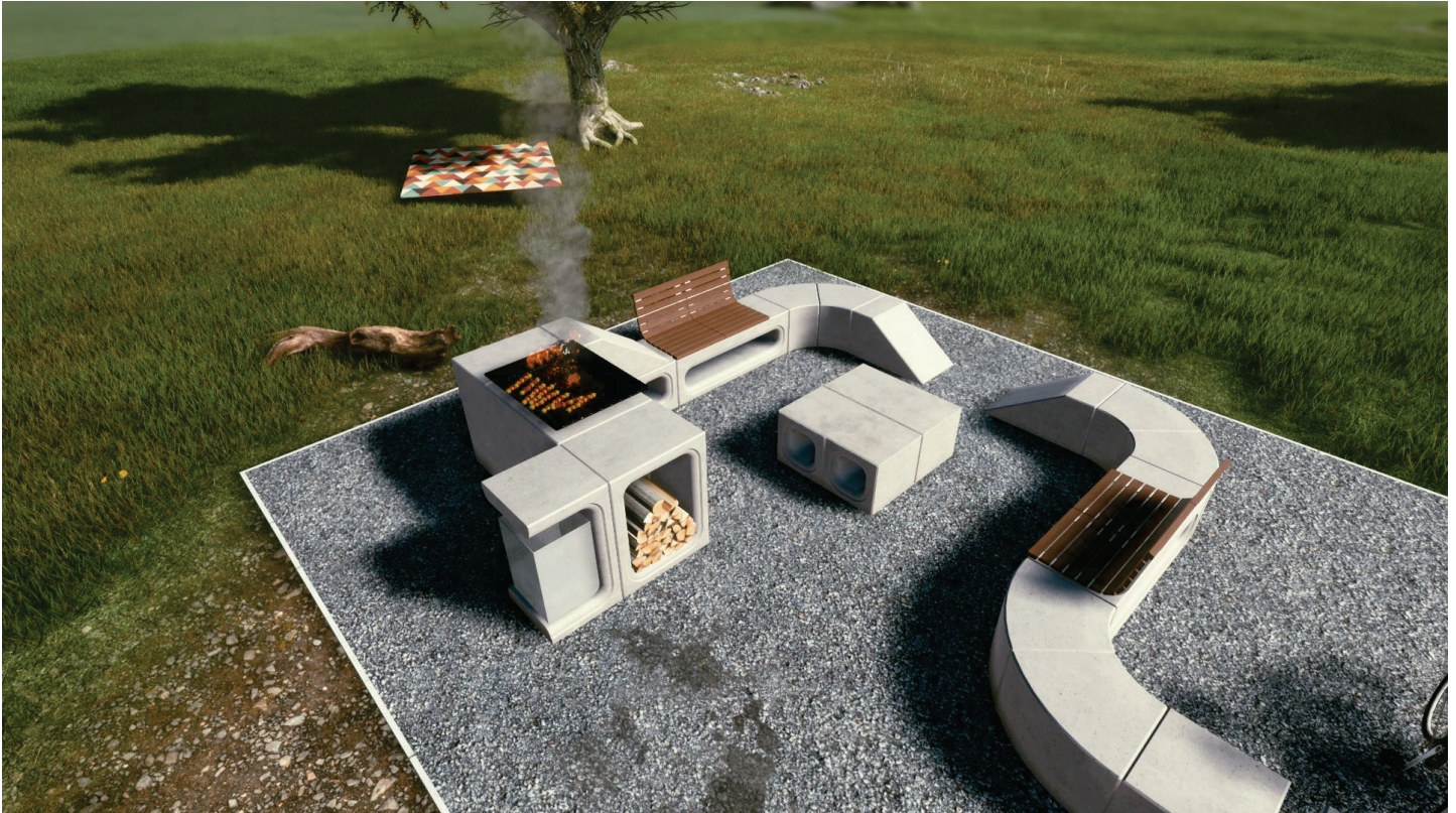
Obrázek 3a Sestava s hybridem

Sestava na obrázku 3 se skládá z níže uvedených dílců, ceny jsou uvedeny bez DPH: