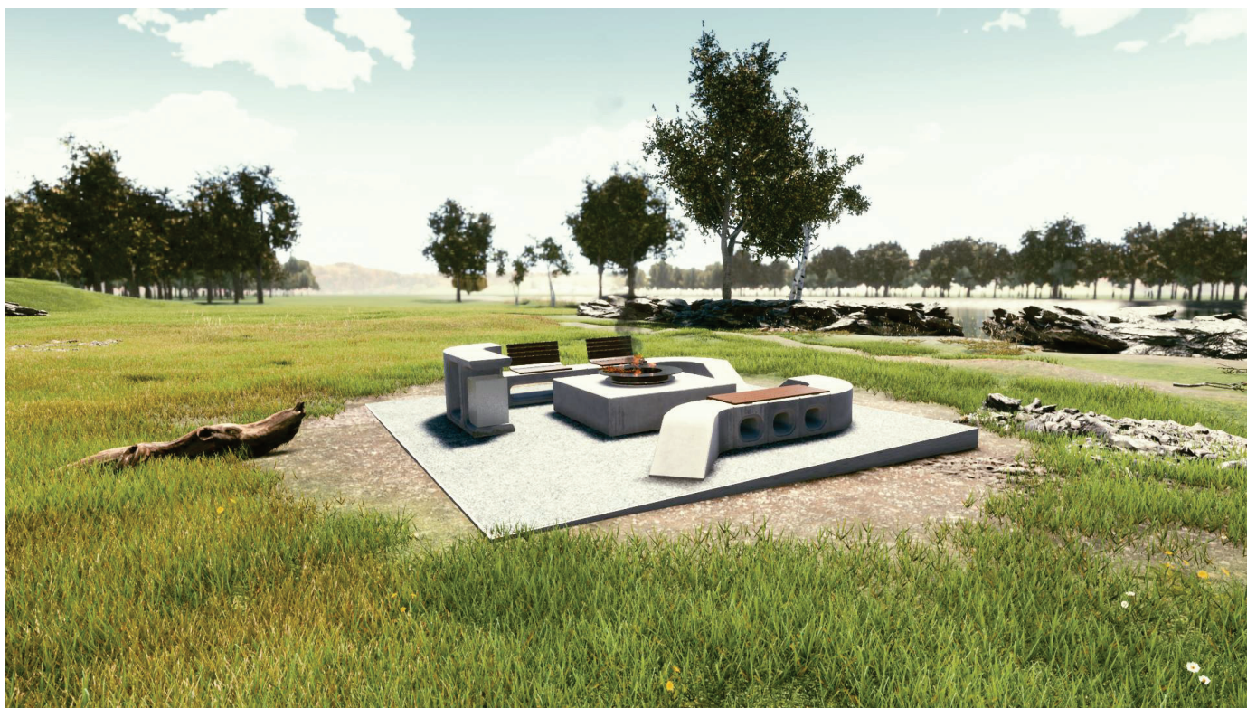
Obrázek 2a Sestava s veřejným ohništěm