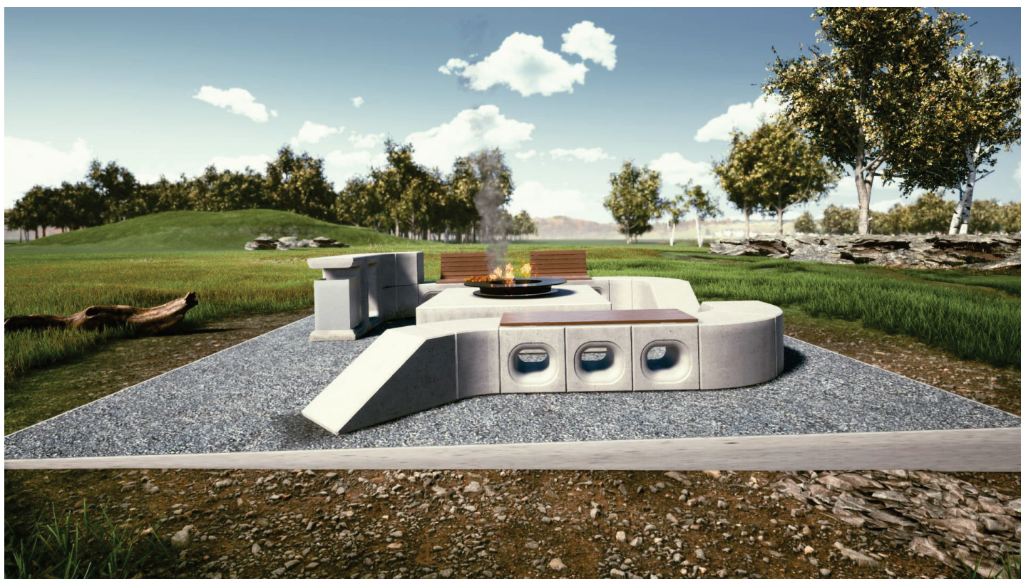
Obrázek 2b Sestava s veřejným ohništěm