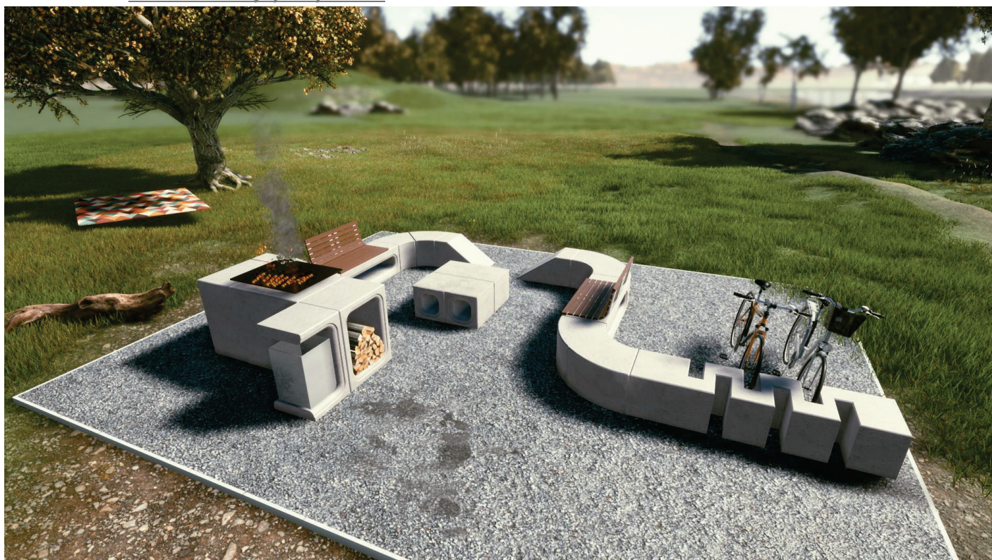
Obrázek 3 Sestava s hybridem