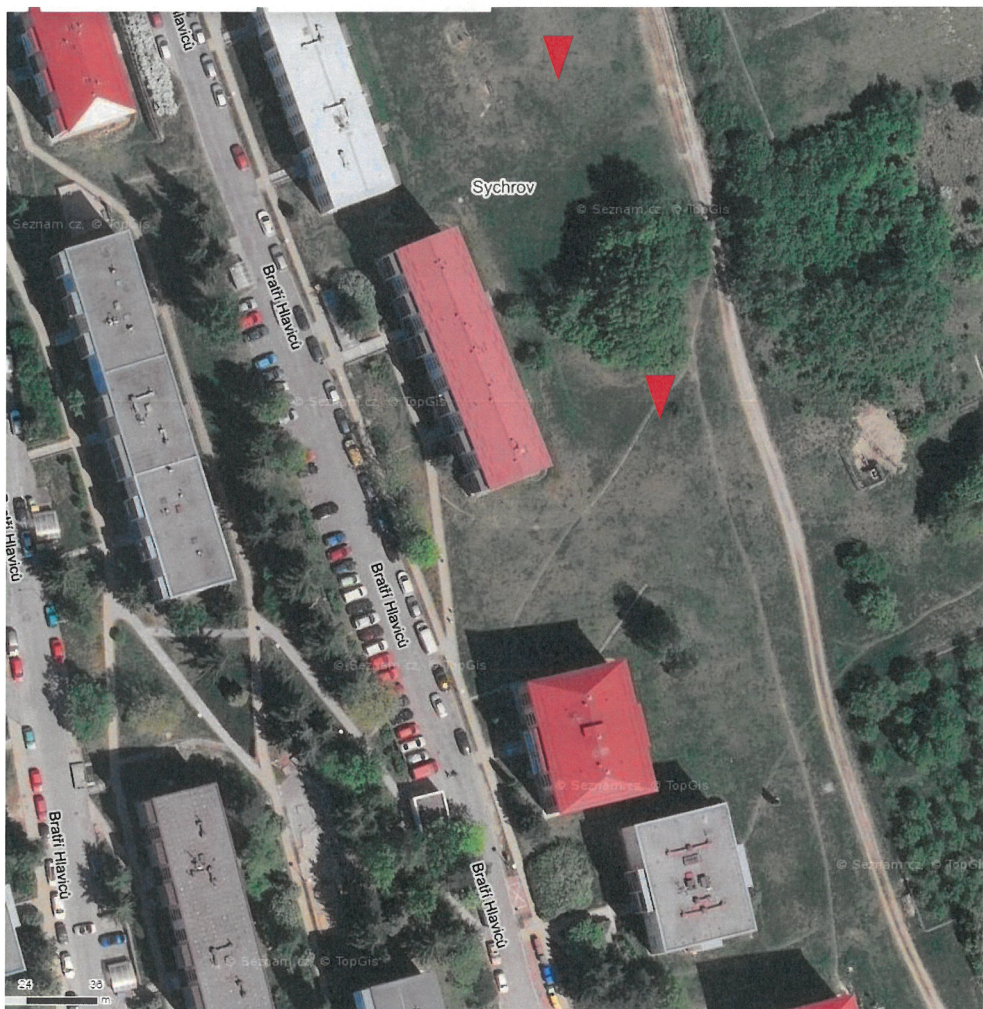
Sychrov – horizont kopce – p. č. 805/4 Majitel: Město Vsetín