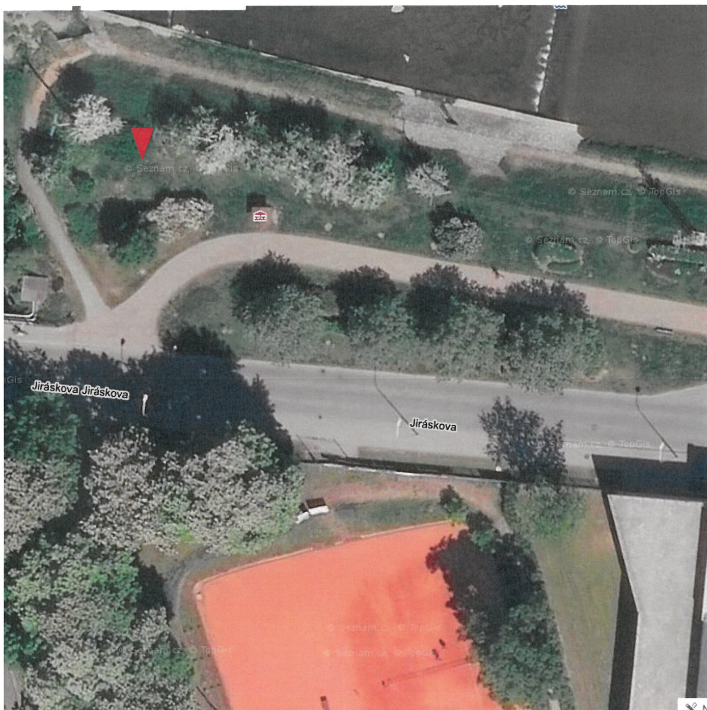
Trávníky – u odpočívadla – p. č. 2515 Majitel: Město Vsetín