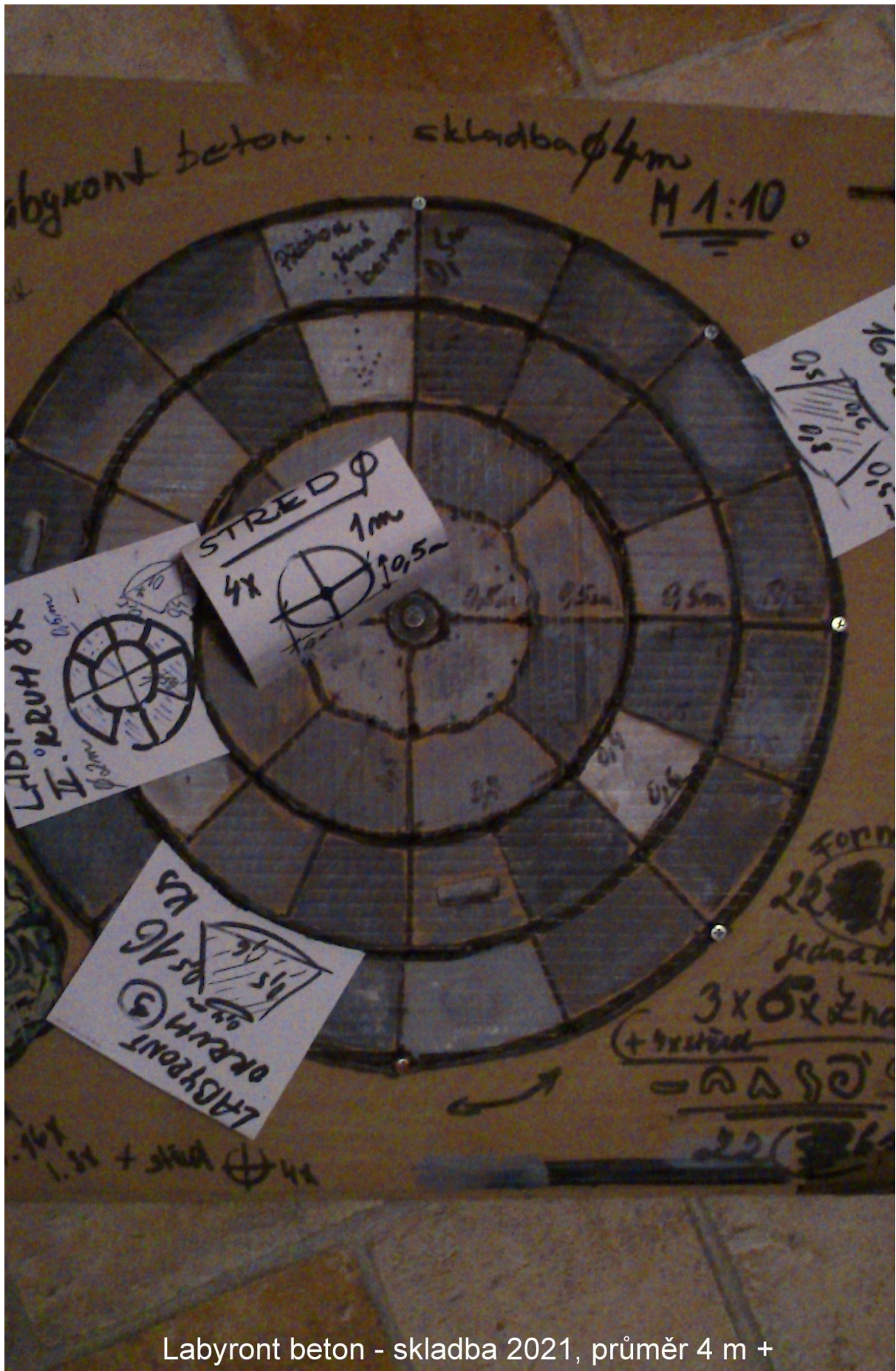
Labyront beton - skladba 2021, průměr 4 m +